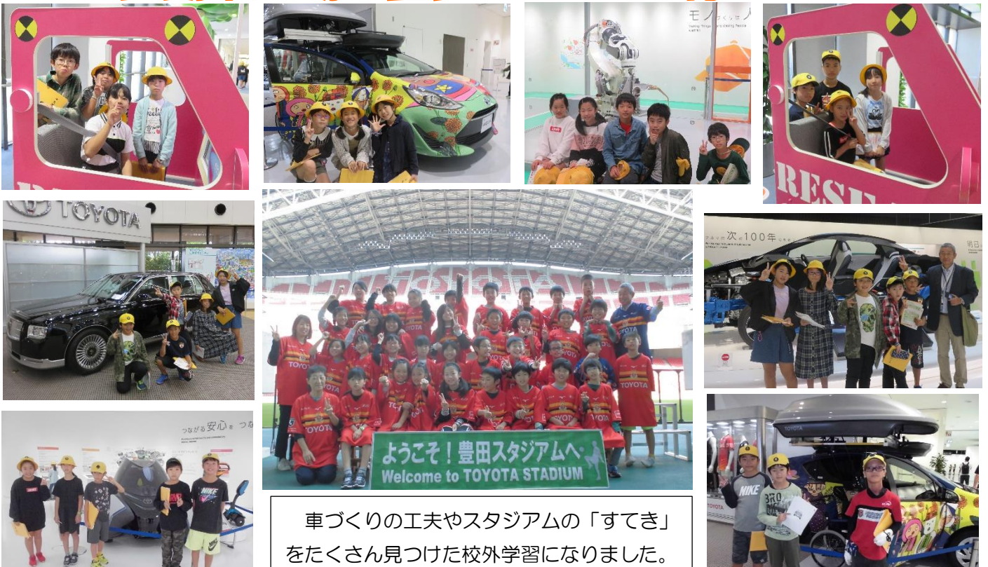
車づくりの工夫やスタジアムの「すてき」をたくさん見つけた校外学習になりました。