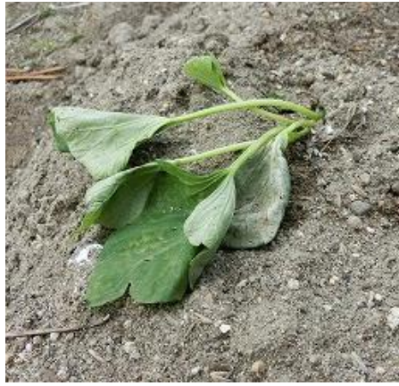
かたち やさいだよ。 つるがどんどのびるあまくて おいしいおもだよ。