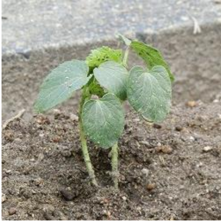
ほし 星のような形の