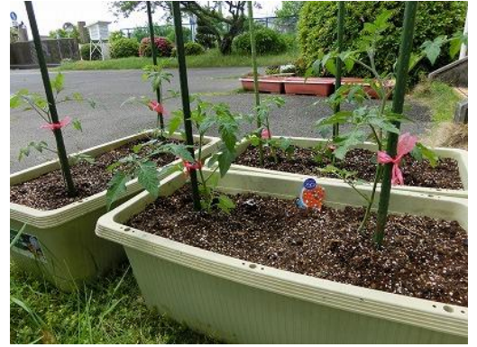
あか きいろ ちい まる 赤や黄色の小さな丸いみか なるよ。