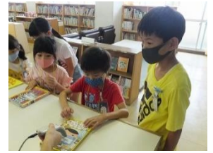
【4年生との交流 ～掃除の手順を伝えよう～ ～図書室の使い方(本の借り方・返し方)を伝えよう～】