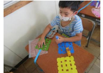
【3年生との交流 ～チョコチョコ飾りを掲示しよう～】