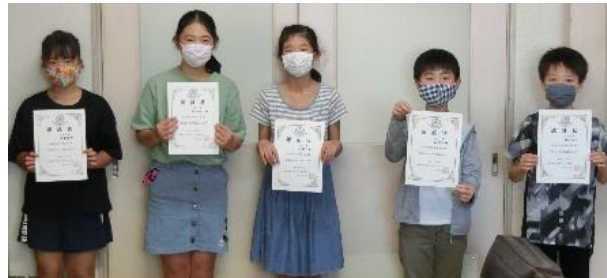
【令和2年度学級委員】