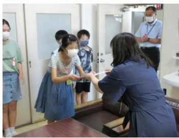
【令和2年度 委員会 委員長】