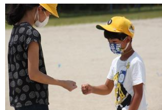
【6年生との交流 ～一緒に遊ぼう～】